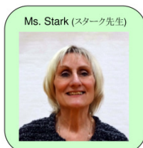
Ms. Stark (スターク先生)